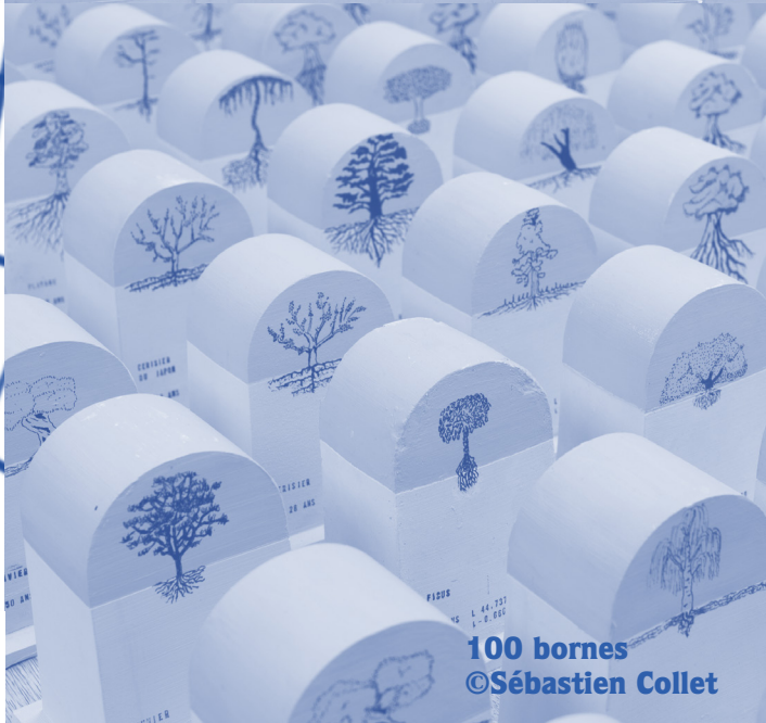
100 bornes