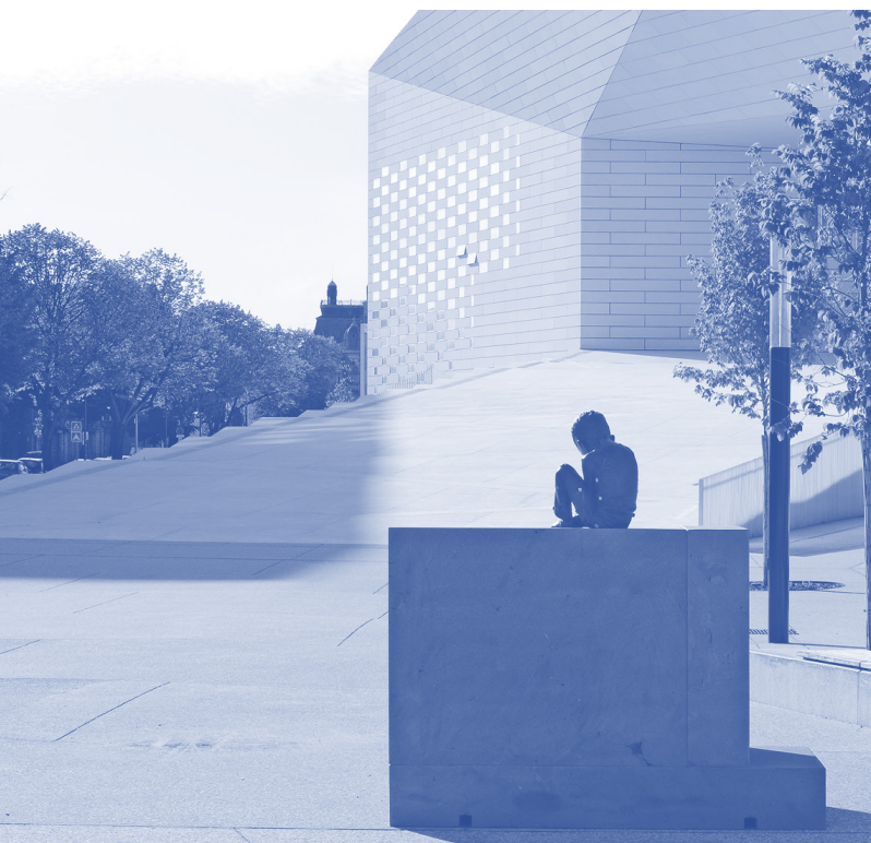
Laurent Montaron, Olivier Vadrot Bronze et lave de Chambois

Installée sur le parvis Corto Maltese en 2020, la première pièce du triptyque, Etude sur la nature des choses, L'eau , évoque l'écoulement du temps. Elle présente un enfant assis, recueillant l'eau de pluie au creux de ses mains. L'eau perle lentement et vient creuser la pierre sur laquelle elle tombe goutte-à-goutte. La deuxième sculpture Etude sur la nature des choses, Le vent a été installée en 2022 sur le parvis de la gare. L'enfant de la sculpture semble souffler sur les coupelles d'un anémomètre lequel émet un léger sifflement. Le mouvement circulaire de l'air interroge le principe de causalité et nous renvoie au mystère de l'origine des choses. La dernière œuvre du parcours attendue en 2024 s'activera avec le soleil.