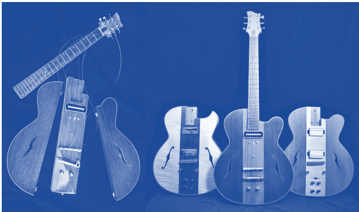
Guitare modulaire Osiris

Au cours des différentes éditions, plusieurs métiers d'art ont ainsi pu être mis à l'honneur à travers des créations inédites répondant aux besoins spécifiques des associations.