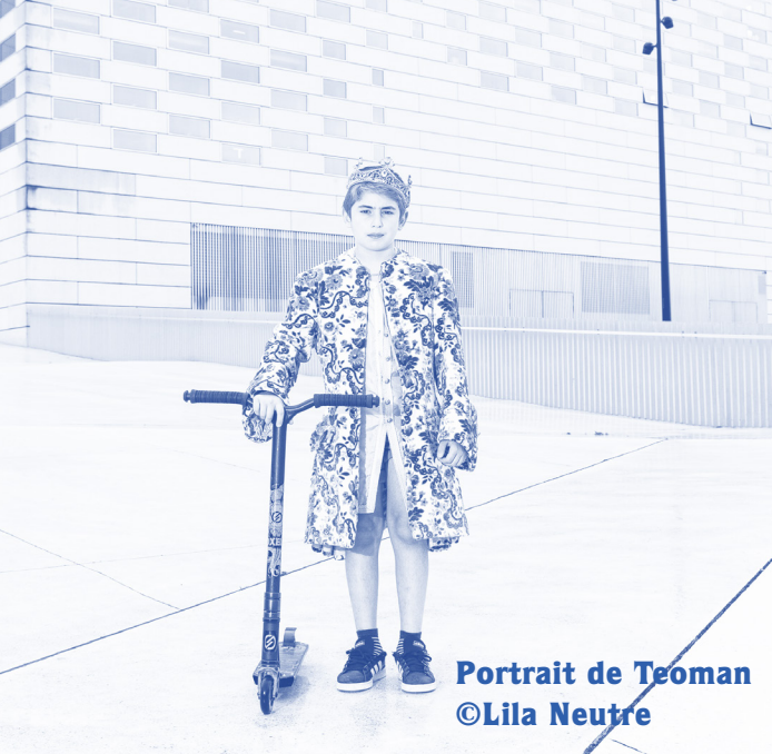
Portrait de Teoman